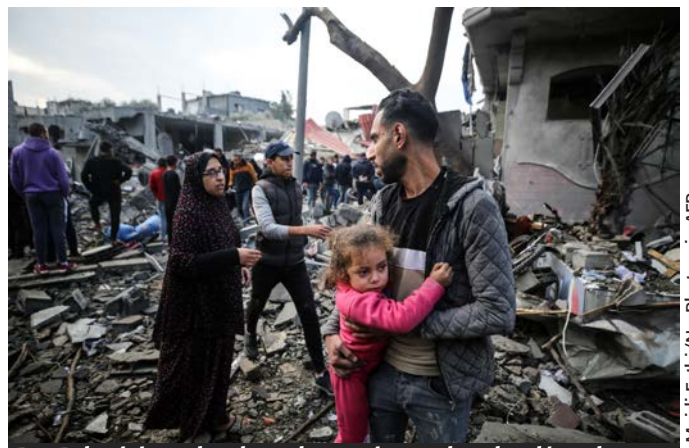
Des Palestiniens cherchent des survivants dans les décombres d'un immeuble après les frappes israéliennes sur le camp de réfugiés d'al-Maghazi, dans le centre de la bande de Gaza, le 25 décembre.