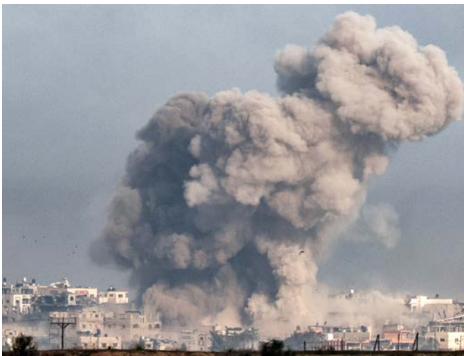
Bombardements le 27 décembre au nord de la bande de Gaza.