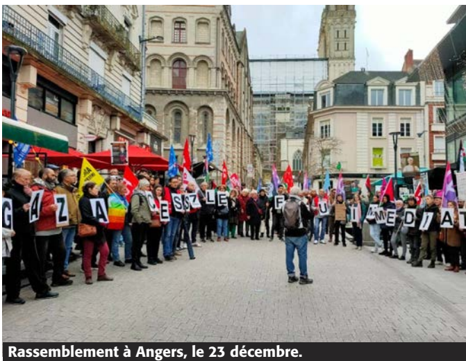
Rassemblement à Angers, le 23 décembre.