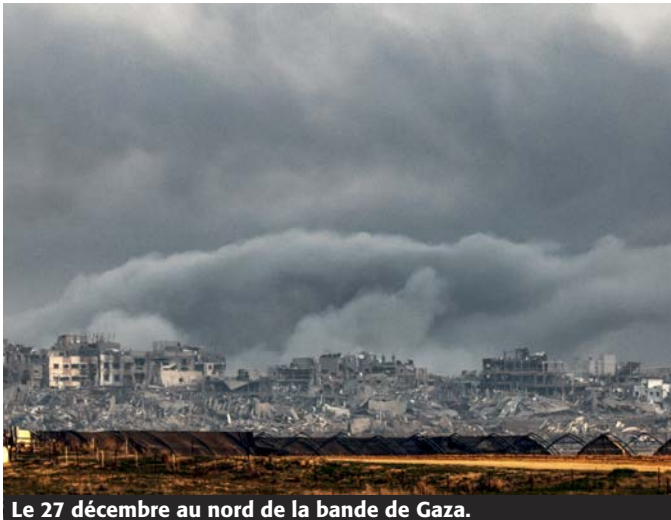
Le 27 décembre au nord de la bande de Gaza.