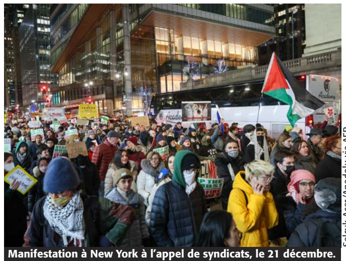
Manifestation à New York à l'appel de syndicats, le 21 décembre.