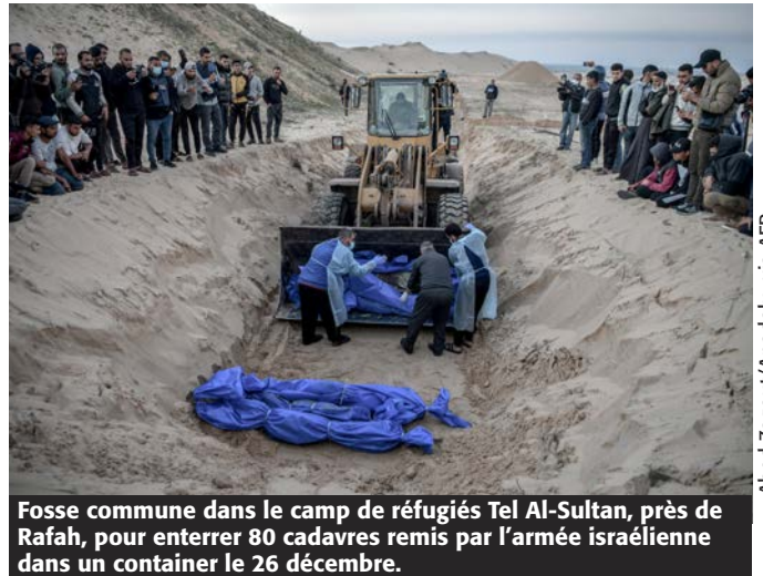
Fosse commune dans le camp de réfugiés Tel Al-Sultan, près de Rafah, pour enterrer 80 cadavres remis par l'armée israélienne dans un container le 26 décembre.