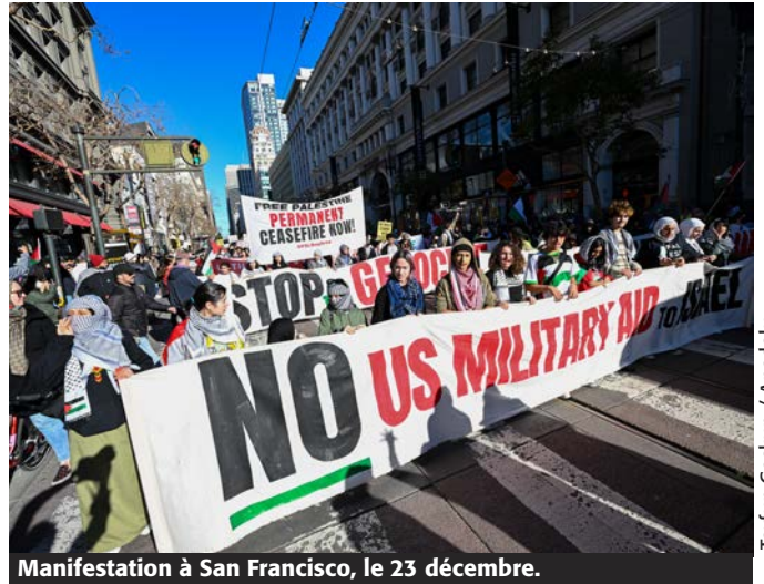
Manifestation à San Francisco, le 23 décembre.