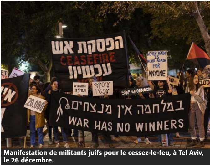
Manifestation de militants juifs pour le cessez-le-feu, à Tel Aviv, le 26 décembre.